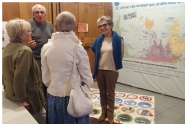
Accueil avant la messe, à Sète