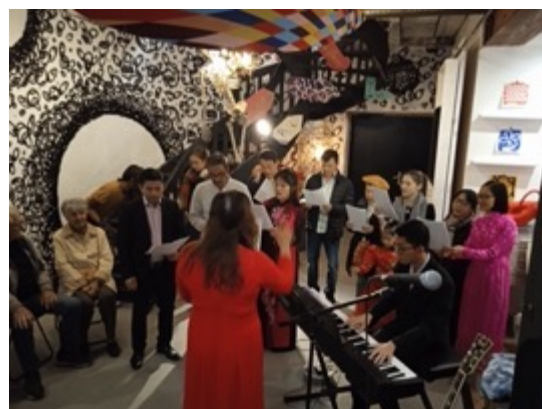
Musique du Vietnam